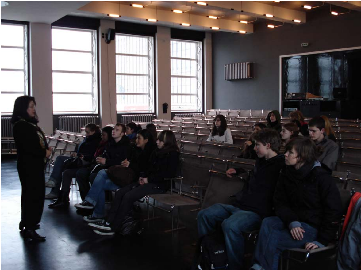
Sitzprobe im Bauhaus - Theater