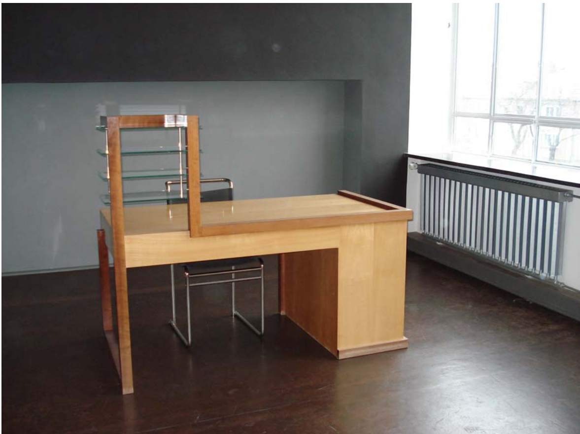
Das Arbeitszimmer von Walter Gropius und sein Originalschreibtisch