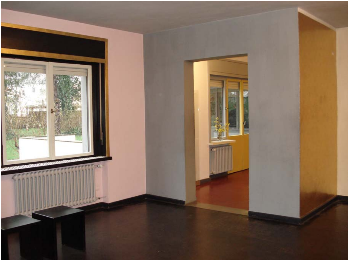
In einem der neu renovierten Meisterhäuser