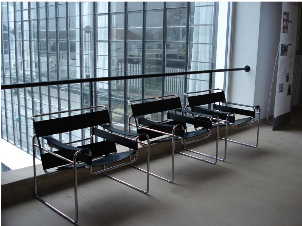
Typisch „Bauhaus“ - 3 x Stahlrohrsessel von Marcel Breuer