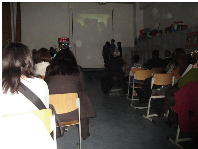
Filmpräsentation vor Eltern

ebenso wie der Umgang mit den Medien. Damit sind wesentliche Ziele der Projektarbeit in dieser Klasse weiterentwickelt worden und somit Grundpfeiler des Konzepts des mathematisch-naturwissenschaftlichen Profils erfüllt.