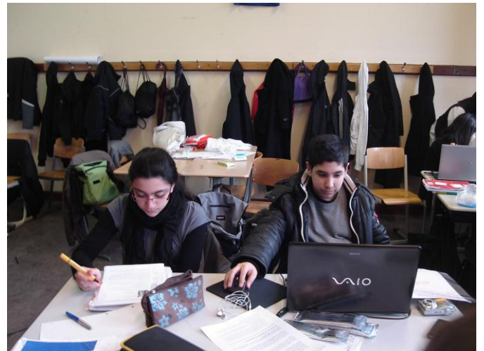
Jeder hat seine Aufgabe in der Gruppenarbeit