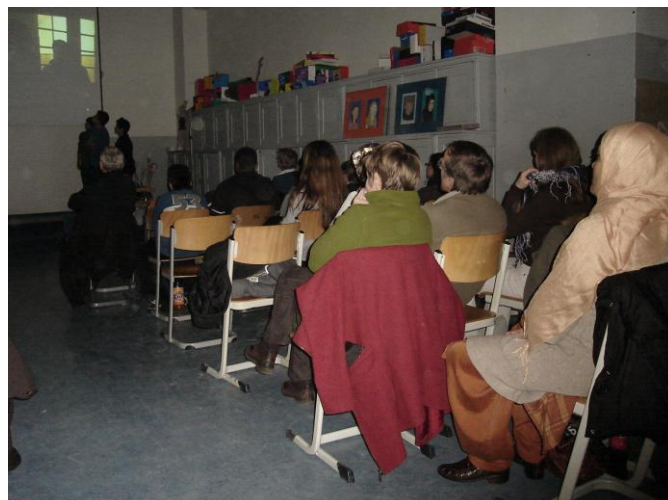
Eltern zeigen großes Interesse an der Arbeit ihrer Kinder