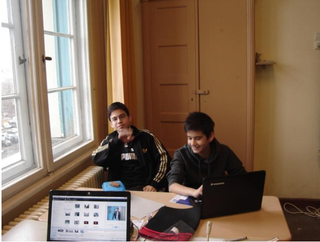
Arbeiten am Laptop