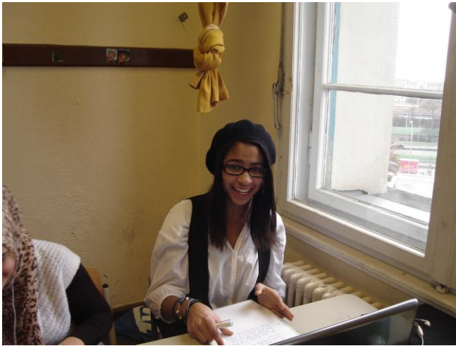
Projektarbeit macht Spaß