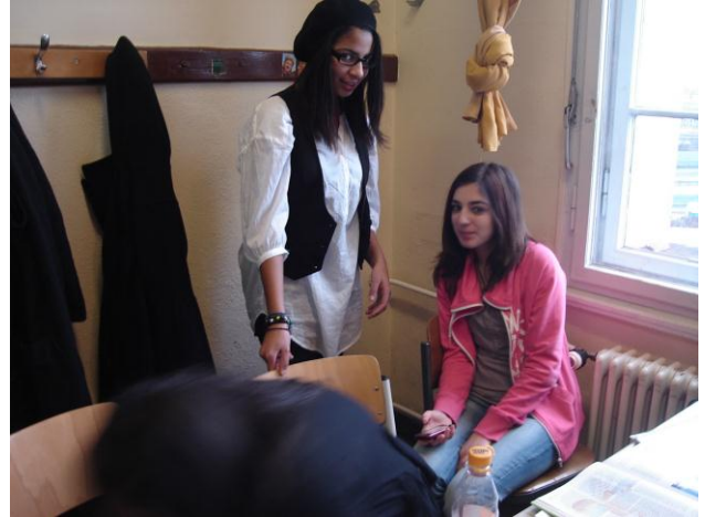
Üben von Filmszenen