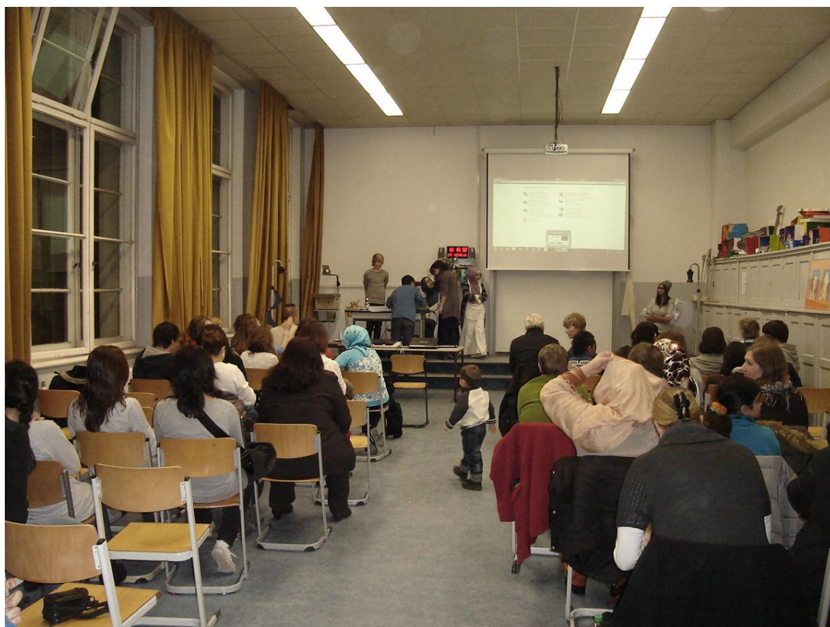
Vorbereitung für den nächsten Film