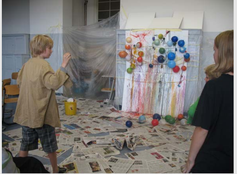
...und das Ergebnis