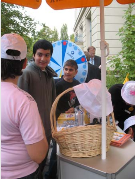
Zahlreiche Stände erwarteten die Besucher...