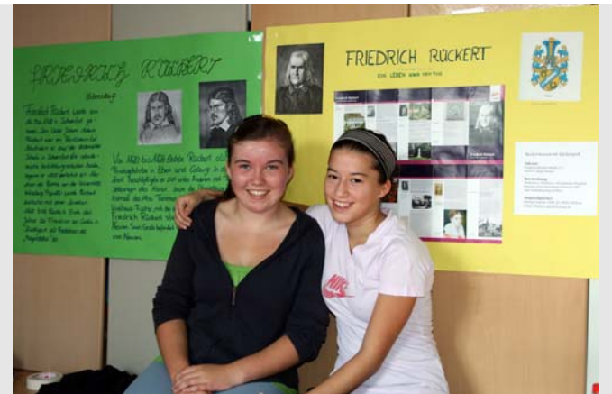
Ausstellung der Klasse 8c über Friedrich Rückert