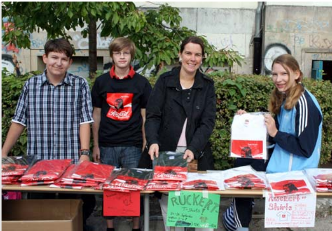
Verkauf der Rückert T-Shirts