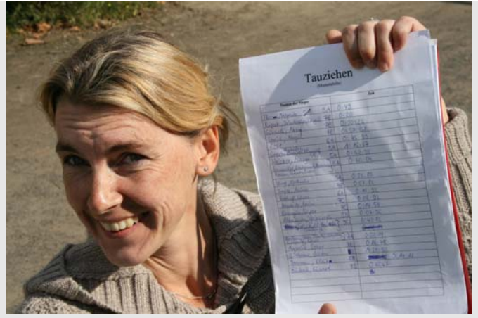
Frau vom Hofe