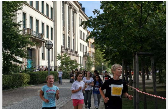
Sponsorenlauf der Mittelstufe