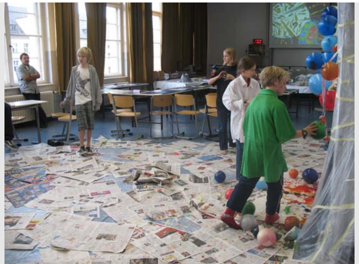
Kunsthappening der Klasse 6a...