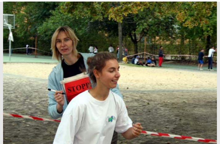
Markieren der gelaufenen Runden