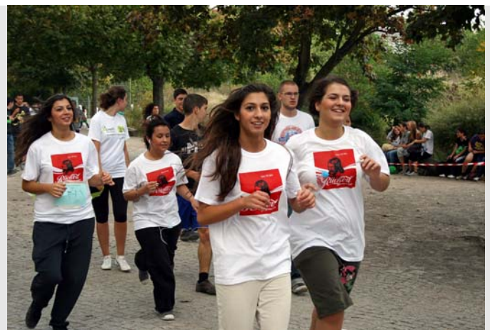
Gut gelaunt lief auch die Oberstufe