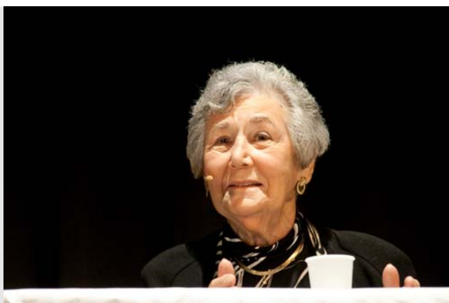
Frau House, New York