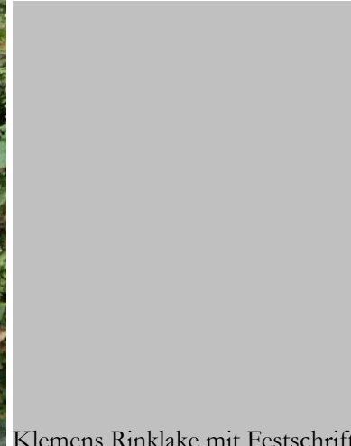
Klemens Rinklake mit Festschrift

Aus Anlass des Schuljubiläums ist eine 154-seitige Festschrift „Hundert Jahre Rückert-Schule - Rückblicke - Überblicke - Ausblicke“ erschienen. Darüber hinaus ist die Festschrift ein Jahresbericht mit allen Klassenfotos und einer bebilderten Chronik zu den Schulereignissen des Jahres 2008/9. Die Festschrift ist für 10 € im Sekretariat erhältlich.