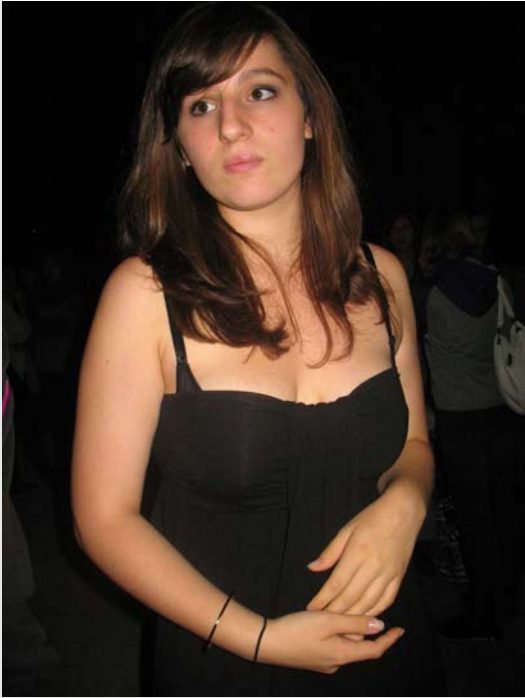
Festlich gekleidet für den Ball