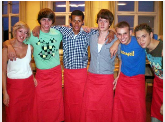
Catering beim Ball: Rückert-Schüler können auch kellnern