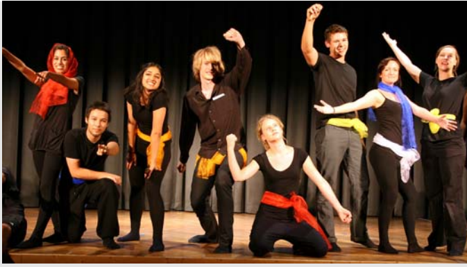
Szenische Collage des Kurses Darstellendes Spiel