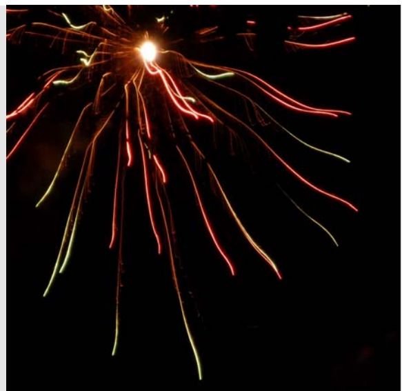
Beeindruckender Abschluss um 22.30 Uhr