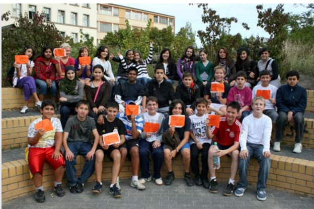
Klasse 7e nach dem Sponsorenlauf