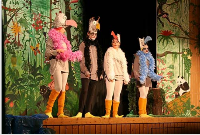
Musical-Aufführung „Das Dschungelbuch“