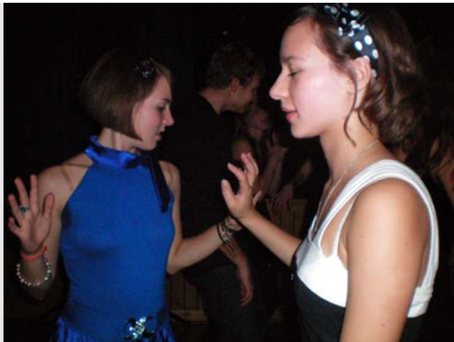
Tanz zur Musik der Big Band